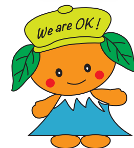
静岡支部マスコット しずOKちゃん